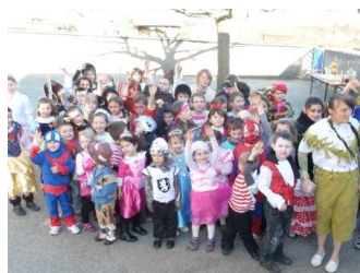
Carnaval des Ecoles

En raison des fêtes de Pâques (Dim. 8 avril) le relevage des ordures ménagères est annulé et reporté à la semaine suivante. Aucun changement pour la Pentecôte (Dim. 27 mai).