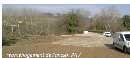
réaménagement de l'ancien PAV