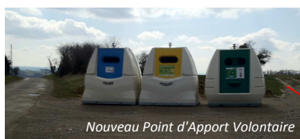
Nouveau Point d'Apport Volontaire

A consommer sans modération : Le tri sélectif par apport aux points de collecte, soit le nouveau, soit l'ancien en cours de transformation pour être encore plus accessible