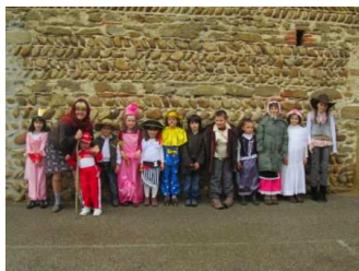
Les Bugnes du Sou des Ecoles